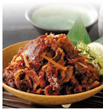
※写真は盛り付け例です。

■肉厚で歯ごたえのある北海道の栄養豊富でおいしい蝦夷舞茸と赤身の柔らかいお肉の北海道産の旨味が凝縮されたこだわりの贅沢な牛しぐれ煮です。調味料(アミノ酸等)は使っておりません。 100g 230g 78×57×57mm 2340g 79×309×123mm 4920g 95×315×260mm 4920g 20(10入×2) 1年 850円(税抜き) GTIN 14932816716949