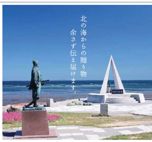
北の海からの贈り物 余さず伝え届けます。